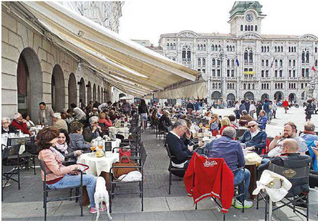
In regione un mosaico di stili e di modi di vivere